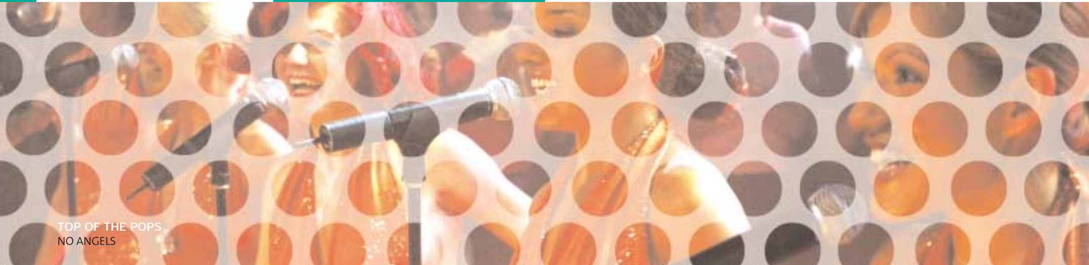
TOP OF THE POPS NO ANGELS

Thanks to the tight cost management and the implementation of the restructuring program, the third quarter saw a return to a positive cash flow of DM 3.6 million, with liquid funds increasing to DM 16.2 million.